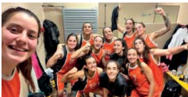
Les jugadores del SaFa Claror, celebrant la victòria contra el Prat.

El sènior A femení del SaFa Claror afronta el proper partit de lliga contra el Joventut L'Hospitalet amb la moral d'haver aconseguit la primera victòria de la temporada i confiant que el triomf a domicili de dissabte passat contra el Prat (55-63) suposi l'inici d'una dinàmica positiva de resultats. L'equip que entrena Marc Vilat rebrà diumenge 27 (14h) el conjunt hospitalenc, que ocupa la