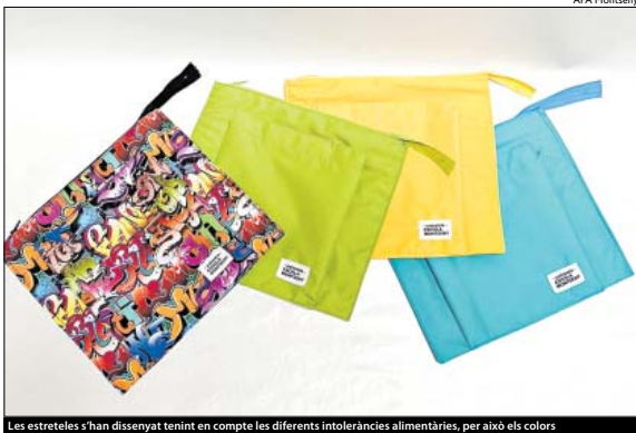
Les estretelles s'han dissenyat tenint en compte les diferents intoleràncies alimentàries, per això els colors

L'escola Montseny ha fet una nova passa aquest curs en la línia pedagògica del centre, que té la sostenibilitat com un dels seus eixos principals. Juntament amb el feminisme, la natura és un dels temes transversals amb que l'Associació de Famílies treballa les diferents accions que porta a