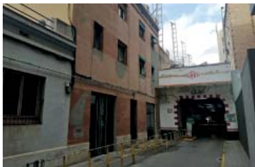
L'entrada al pàrquing des de Torrent de l'Olla, ja en plena illa interior.

La traducció d'aquesta voluntat política de fer aflorar un nou equipament esportiu a la Vila ("una obsessió del regidor", apunten fonts municipals) està ben avançada a partir dels estudis previs que la direcció de serveis tècnics del districte ja ha elaborat en dècimes mesos i que han certificat que l'espai de l'illa interior Còrsega-Perill és l'idió per dimensions, calendari i rapidesa d'execució. "Per mida encaixa", afegeixen.