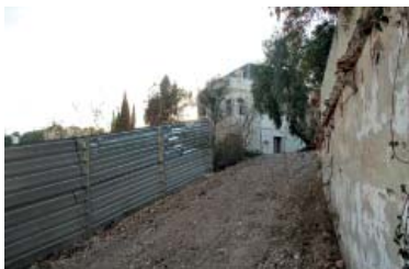
L'accés a la casa Canals i Junyer des del carrer Bèquer.

El joc de continuïtat amb els nous jardins que s'obriran al públic, en els quals s'hi treballarà un cop s'enllesteixi la primera fase de buidatge i remodelació del casalt, activada el febrer passat, es concretarà amb els nous jardins. "Cal posar en valor la plataforma del jardí, amb els seus merlets, arcs i xiprers", diu la memòria de la