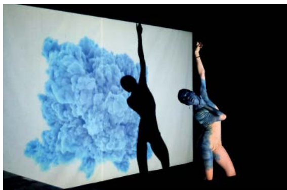
Una de les actuacions al Lens Dans 2021.

El festival amb ànima gracienc nascut per impulsar la videodansa repeteix a Brussel·les al febrer i sumarà teatre