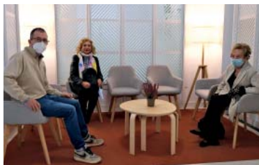
Tres usuaris d'ARAPDIS asseguts a la nova sala d'espera.