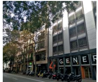
El frontal de Còrsega, per on s'accediria al nou pavelló.

A primera vista inversemblant per l'alta densitat de la zona, el futur pavelló, segons han explicat fonts municipals, "encaixa" i s'hi projecta una possible entrada des de Còrsega. "S'hi està treballant", ha reblat fins i tot la consellera d'Esports del districte, Mercè Saltor. Pàgina 3