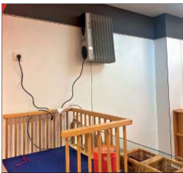
La nova instal·lació a l'escola bressol Sant Medir, aquest dilluns.

La protesta va esbombar-se dividendes quan la direcció va enviar un correu a les famílies perquè portessin aquest dilluns "alguna manteta per a l'estona del descans" i la repercussió mediàtica durant el cap de setmana a nivell de xarxes socials va fer moure's amb rapidesa els serveis municipals. Però, com que l'adjudicació del manteniment pendent ha de seguir els seus terminis, dilluns mateix l'IMEB va demanar al