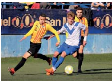
Pastells, en l'últim derbi que es va jugar al Nou Sardenya (0-2).

Per partit contra el Sant Andreu, Senabre tindrà disponibles a tots els seus jugadors, a excepció de