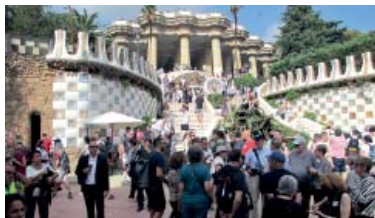
Turistes i visitants a la zona monumental del Park Güell.

Sota el lema de la reutilització del recinte, després de quatre anys de "restauració" entre 2013 i 2018 i quatre més de "rehabilitació" entre 2018 i 2022, l'Ajuntament ha presentat dades en el consell de barri de la Salut fent una radiografia de l'usuari gratuït, que suposa un 10% de les visites. "Entre l'1 de gener i el 30 d'octubre hem validat 369.369 entrades gratuïtes, i no arribarem en cap moment enguany als 4,5 milions de visitants; ens que-